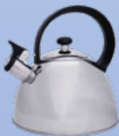
1 litro de água filtrada e fervida