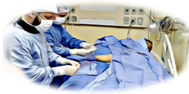
Equipe de Enfermeiros no procedimento de inserção do PICC.

Após o término do procedimento, o PICC estará pronto para a utilização.