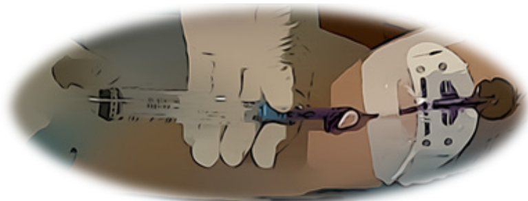
Salinização do PICC.

A coleta de sangue por esse cateter pode ser realizada apenas por enfermeiros, mediante autorização da equipe que inseriu o PICC.