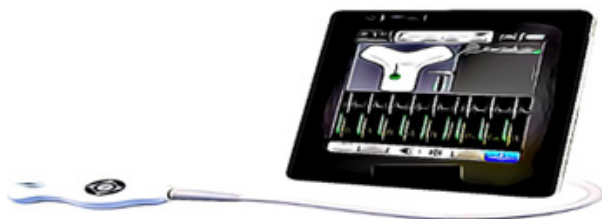
Aparelho de ultrassom vascular

Antes do procedimento, a (o) enfermeira (o) irá realizar uma avaliação e definirá, com o auxílio de um aparelho de ultrassom, qual a melhor veia do braço para colocação. Após esta definição, o procedimento é marcado, podendo ser realizado no mesmo dia da avaliação, ou quando o Time PICC tiver disponibilidade de horário para este procedimento.